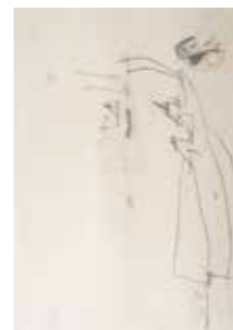
45 Jürgen Messensee Mercedes-Mercedes 1993, Bleistift und Öl auf Papier, 54 x 50 cm Rufpreis € 1.800,-