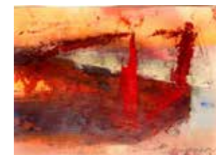
48 Maria Moser o.T. 2017, Mischtechnik auf Papier, 24 x 34 cm Rufpreis € 500,-