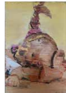
24 Gordon Markus Gerstner Puppe kaputt 2015, Öl auf Leinwand 60 x 40 cm Rufpreis € 1.000,-