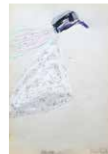
20 Tone Fink Frauenhaube 2014, Mischtechnik auf Papier, 30 x 21 cm Rufpreis € 750,-