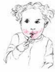
4 Danijela Bagaric Doja 2015, Tusche und Pastell- kreide auf Papier 29,7 x 21 cm Rufpreis € 150,-