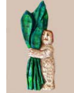
59 Annerose Riedl Grünzeug V 2020, Lindenholz bemalt 40,5 x 13 cm Rufpreis € 400,-