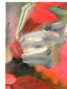
68 Katja Vassilieva o.T. 2017, Kasein Tempera auf Leinwand, 40 x 30 cm Rufpreis € 600,-