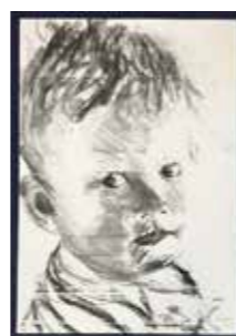
64 Oskar Stocker Laila 2015, Kohle auf Papier 100 x 70 cm Rufpreis € 500,-