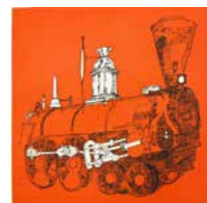
62 Rudolf Schönwald Kleine Lokomotive Edition von 100 2012, Strichradierung u. Aquatinta auf Arches Bütten, 59,5 x 60 cm Rufpreis € 300,-