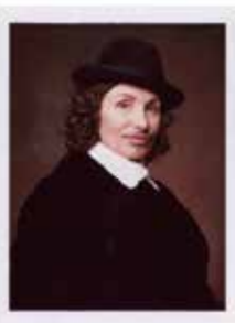
1 Irene Andessner Art Protectors, Portraits nach Franz Hals 2010, Kleinpolaroid Unikat 12 x 9 cm Rufpreis € 1.350,-