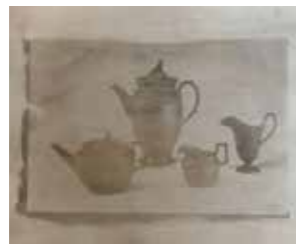
41 Christian Kosmas Mayer Black Basalt 2009, Salzprint auf Leder, 38,5 x 46,5 cm Rufpreis € 900,-