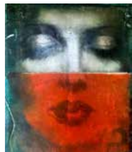
22 Margit Füederer Infiltration 2019, Öl auf Leinwand 80 x 70 cm Rufpreis € 800,-