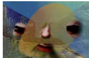
13 Johannes Deutsch Somnus/Skizze 1 2003, Fujiflex 32 x 47 cm Rufpreis € 900,-