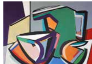
56 Antonia Riederer EVERY DAY 2020, Acryl auf Lein- wand, 90 x 130 cm Rufpreis € 800,-