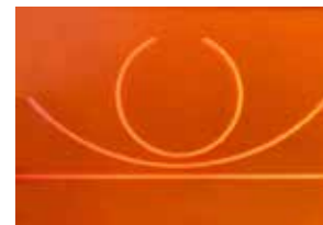
10 Hellmut Bruch 3 gleiche Längen 2017, Frästechnik 21 x 29,7 x 3 cm Rufpreis € 600,-