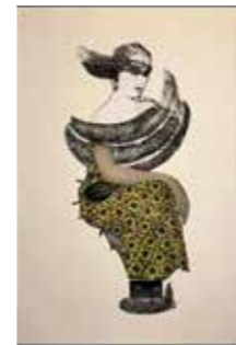
34 Ingrid Kowarik o.T. 2018, Collage auf Papier 42 x 29,5 cm Rufpreis € 440,-