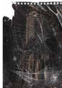
15 Christian Eisenberger Spinnenlinien 2015, Spinnwabe, Acryllack 32,5 x 23,5 cm Rufpreis € 600,-