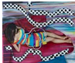
53 Martin Praska Onkel Alfred 2014, Acryl und Leinwand auf Segeltuch 70 x 80 cm Rufpreis: € 2.000,-