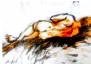
14 Alina Dimitrieva o.T. 2018, Acryl auf Karton 50 x 70 cm Rufpreis € 250,-