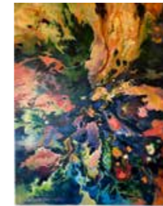
36 Wilhelm Laufer o.T. 2017, Acryl auf Leinwand 80 x 60 cm Rufpreis € 500,-