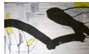
55 Anna Reschl „this humanworld x“ 2018, Mischtechnik auf Leinwand, 42 x 60 cm Rufpreis € 250,-