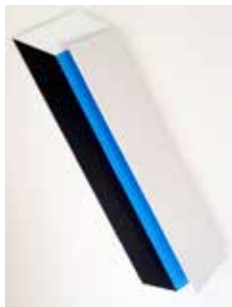
21 Gerhard Frömel Farbraumkörper weiß, schwarz, saphirblau 2015, Aluminium/Acrylfarbe 37,5 x 12,5 x 4 cm Rufpreis € 750,-