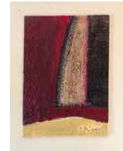
58 Alois Riedl o.T. 2005, Acryl auf Leinwand 23,5 x 16,5 cm Rufpreis € 400,-