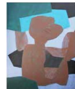
66 Josef Sulek o.T. 2013, Acryl auf Leinwand 140 x 110 cm Rufpreis € 1.250,-