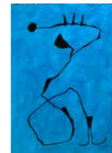
28 Johann Jascha Kaiserin 2017, Bleistift und Farbstift auf Papier 70 x 50 cm Rufpreis € 900,-