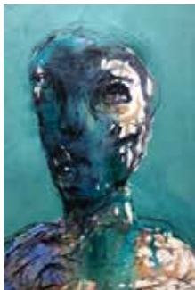
40 Thaer Maarouf o.T. 2016, Acryl auf Bütten- papier 87 x 53 cm Rufpreis € 500,-