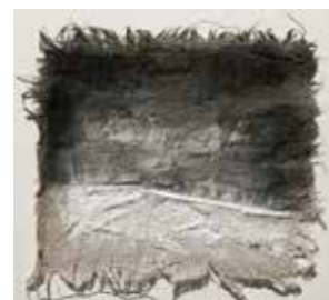
61 Marie Ruprecht Vertraute Welt/Fremde Welt Nr.20 2019, Aquarell auf Leinwand 20 x 21 cm Rufpreis € 300,-