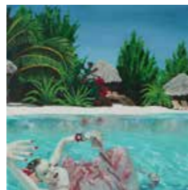
5 Wolfgang Dieter Bauer Where's my Smith & Wessen II? 2010, Acryl auf Leinwand 30 x 30 cm Rufpreis € 800,-