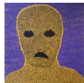
26 Andreas Christian Haslauer face02 2015, Siebdruck, Auflage:#5/20 42 x 59 cm Rufpreis € 300,-