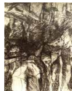
46 Oswald Miedl o.T. 1999/2000, Kreidezeichnung auf Büttenkarton, 57 x 46 cm Rufpreis € 350,-