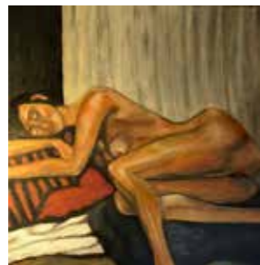
2 Maria Arnsteiner o.T. 2020, Acryl auf Leinwand 100 x 100 cm Rufpreis € 250,-