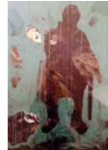
54 Willy Rast o.T. 2017, Acryl auf Leinwand 74 x 56 cm Rufpreis € 500,-