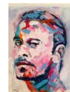
29 Jerson Jiménez Altura 2018, Acryl und Öl auf Leinwand, 50 x 40 cm Rufpreis € 400,-