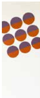
11 Michael Bruns o.T. 2009, Acryl auf Leinwand 18 x 24 cm Rufpreis € 70,-