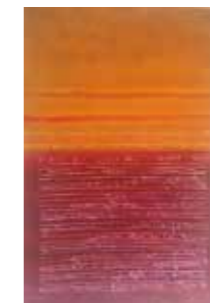
67 Ingrid Tragler Schrifttafel 2013, Siebdruck auf Leinwand, 100 x 65 cm Rufpreis € 700,-