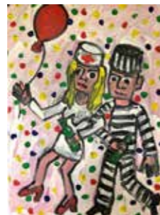
72 Wolfgang Zeindl 2020 - Prosit Covid! 2020, Acryl auf Lein- wand 70 x 50 cm Rufpreis € 700,-

Schaustellung 22. August bis 27. August von 14:00 bis 17:00 Uhr