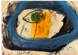
12 Mario Dalpra Serie India 2004, Mischtechnik auf Papier 34 x 43 cm Rufpreis € 600,-