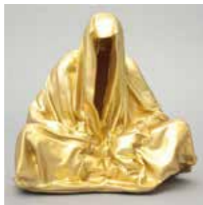
32 Manfred Kielhofer Wächter der Zeit 2017, Kunststoff, Acryl 41 x 40 x 42 cm Rufpreis € 200,-