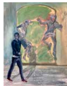
65 Christa Strasser Laufpass 2015, Öl auf Leinwand, 100 x 80 cm Rufpreis € 900,-