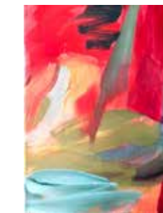
69 Katja Vassilieva o.T. 2017, Kasein Tempera auf Leinwand, 40 x 30 cm Rufpreis € 600,-