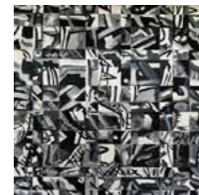
47 Regina Moritz Wnvr1602 schlendern 2019, Öl auf Leinwand 30 x 30 cm Rufpreis € 400,-