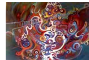
37 Wilhelm Laufer Ringelsui 2014, Acryl auf Karton, Ölfarbe auf Acryl 60 x 80 cm Rufpreis € 500,-