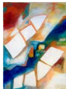
44 Moje Menhardt o.T. 2003, Acryl auf Leinwand 70 x 50 cm Rufpreis € 600,-