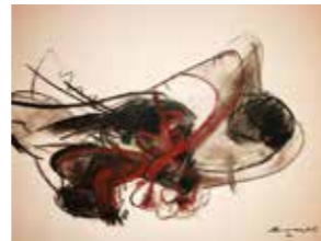
43 Thomas M. Mayrhofer o.T. 2003, Kohle und Pastell auf Papier, 50 x 65 cm Rufpreis € 600,-