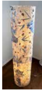
16 Fee Elle Imagine Lichtkörper 2020, Acryl auf Karton 135cm x 30 Rufpreis € 680,-