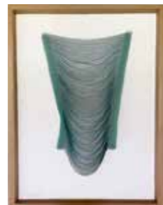
51 Andrea Pesendorfer o.T. 2019, Changanat Fäden gezogen 40 x 30 cm Rufpreis € 800,-