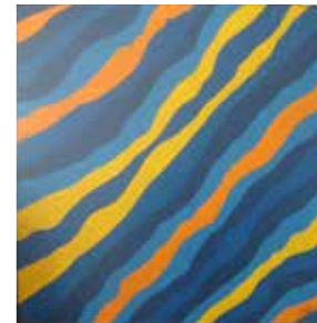
19 Elmar Fetz Farbenspiel 2004, Öl auf Leinwand 75 x 85 cm Rufpreis € 350,-