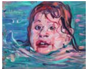
31 Guido Katol Schwimmerin 2 2018, Öl auf Leinwand 60 x 74 cm Rufpreis € 1.500,-