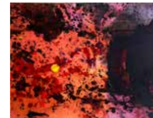
9 Herbert Brandl o.T. 2010, Siebdruck auf Öl und Papier 56 x 76 cm Rufpreis € 1.500,-