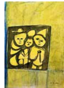
7 Franz Blaas Großfamilie 2007, Pastell, Tusche auf Büttenpapier 42 x 30 cm Rufpreis € 500,-