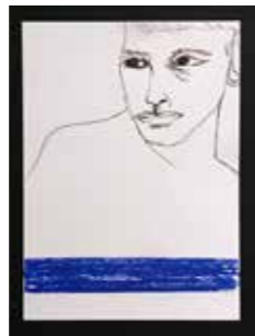
3 Sara Arnsteiner o.T. 2017, Tusche und Pastell auf Papier 14 x 8,21 cm Rufpreis € 100,-