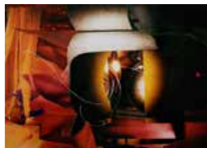
71 Anita Witek High_performance, Auflage 5/10 2014, C-type Print 31 x 43 cm Rufpreis € 300,-