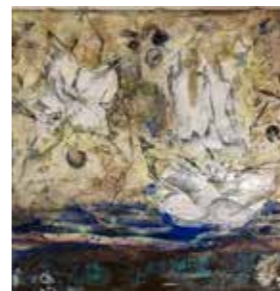
17 Fee Elle Wassermannzeitalter 2020, Mischtechnik, Acryl, Graphit, Kohle 60 x 60 cm Rufpreis € 550,-