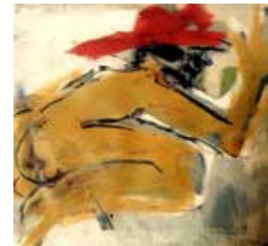
70 Markus Wagenhofer Hey 2015, Öl/ Kohle/Papier 29,5 x 32 cm Rufpreis € 200,-