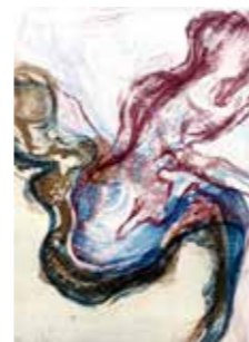
6 Peter Bischof o.T. 1994, Farbradierung 29,5 x 21 cm Rufpreis € 200,-