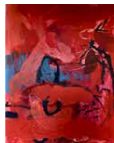
63 Wolfgang Stifter Tiefsee 2008, Öl u. Eitempera auf Leinwand 80 x 60 cm Rufpreis € 1.700,-