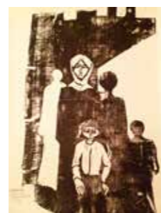
25 Robert Hammerstiel Passanten 1980, Originalholzschnitt, Handdruck, 65 x 50 cm Rufpreis € 300,-