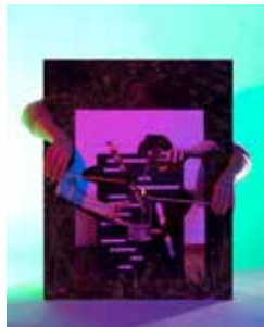
30 Luisa Kasalicky Hand, fließendes Wasser 2018, Pigmentdruck auf Papier, 102 x 80 cm Ed. 3 + 2 Artist Prints Rufpreis € 950,-