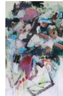
57 Gabi Rhomanko Sommerkind 2019, Acryl auf Lein- wand, 110 x 65 cm Rufpreis € 700,-