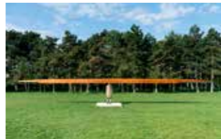
52 Roman Pfeffer Brain Twister (Autogyro- copter) Edition: AP II/III 2015, c-print 42 x 59,5 cm- Rufpreis: € 500,-