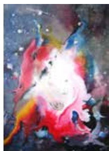
60 Heinrich Rossi o.T. 2007, Tusche/Acryl auf altem Leinen 70 x 50 cm Rufpreis € 350,-