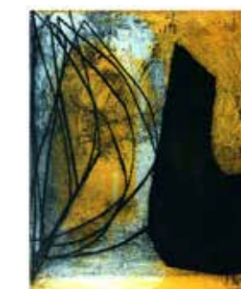
49 Johann Nußbächer o.T. 1997, Farbradierung 76 x 55,5 cm Rufpreis € 200,-