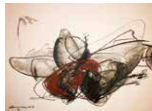
42 Thomas M. Mayrhofer o.T. 2003, Kohle und Pastell auf Papier, 50 x 65 cm Rufpreis € 600,-