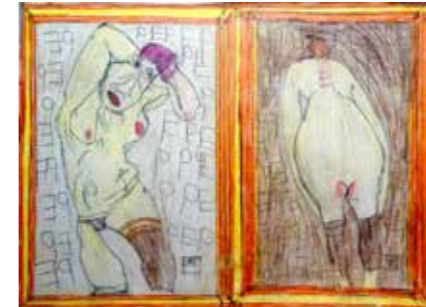
27 Josef Hofer o.T. 2015, Bleistift und Farbstift auf Papier 44 x 60 cm Rufpreis € 1.800,-