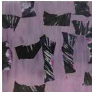
50 Ahmet Oran o.T. 2012, Öl auf Leinwand 130 x 130 cm Rufpreis € 3.500,-